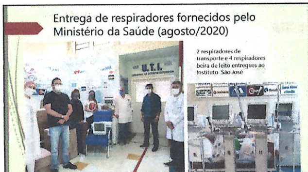
Entrega de respiradores fornecidos pelo Ministério da Saúde (agosto/2020)