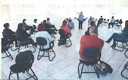
Reuniões do COEM – Comitê de Emergências Municipais