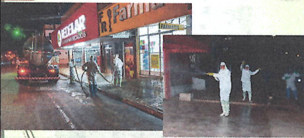
Desinfecção nos locais de grande circulação de pessoas