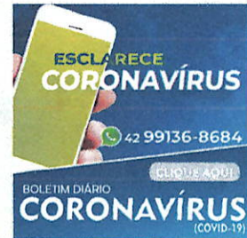
Registro de algumas Ações em Laranjeiras do Sul em 2020