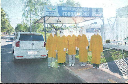
Registro de algumas Ações de enfrentamento ao Coronavírus em Laranjeiras do Sul – abril a novembro de 2020