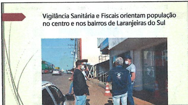
Vigilância Sanitária e Fiscais orientam população no centro e nos bairros de Laranjeiras do Sul