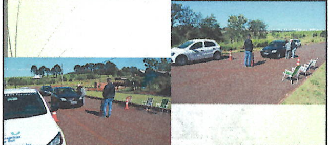
Barreiras Sanitárias – Início da pandemia