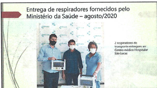
Entrega de respiradores fornecidos pelo Ministério da Saúde – agosto/2020