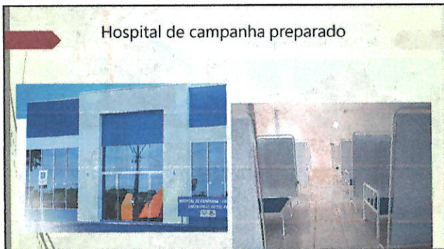
Hospital de campanha preparado